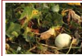
Mildiou sur melon ميلديو على البطيخ