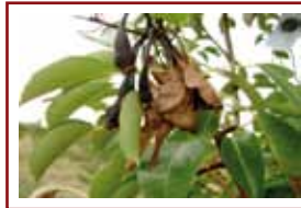
Feu bactérien sur poirier التلفحة البكتيرية على الإجاص

* : Délai avant récolte En moyenne, le volume de bouillie est de : - 1000 L/ha en cultures pérennes - 400 à 600 L/ha en cultures maraichères